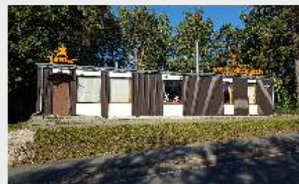
Ceļa zīmju filiāle Cēsīs, Gaujas ielā 70