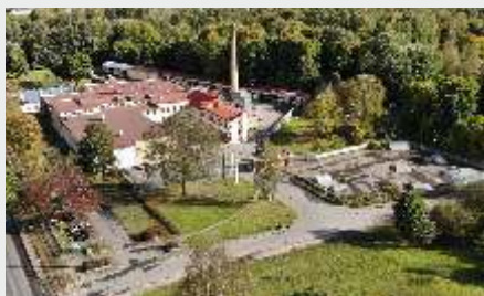
Ražotne Rīgā, Bauskas ielā 143