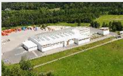
Ražotne Salaspils nov., Saulkalnē