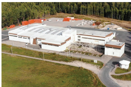
Ražotne Salaspils nov., Saulkalnē