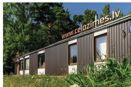
Ceļazīmju filiāle Cēsis, Gaujas ielā 70