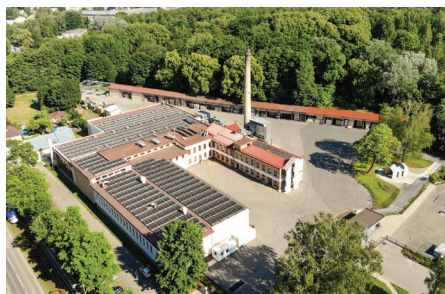
Ražotne Rīgā, Bauskas ielā 143